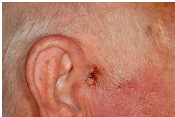
Ung thư biểu mô tế bào đáy: Trước khi điều trị

thời, nó còn thúc đẩy quá trình tái tạo, tăng cường hệ thống miễn dịch do sự có mặt của các hợp chất trong thành phần của kem.