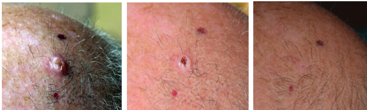
Trước khi điều trị