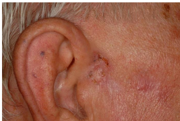
4 tuần sau điều trị