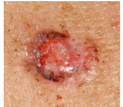
Ung thư da

Mặt trời không phải là kẻ thù của chúng ta, đó là nguồn sống mà nhân loại đã có đủ thời gian để thích nghi trong suốt hàng thiên niên kỷ qua. Tâm hồn và cơ thể con người cần ánh sáng mặt trời, do đó không cần thiết phải sợ hãi những tia nắng. Tuy nhiên, cháy nắng có thể dẫn đến những hậu quả nghiêm trọng: bệnh dày sừng quang hóa và bệnh ung thư da.