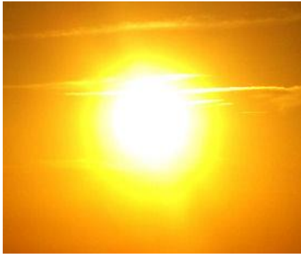
Bức xạ UVB →