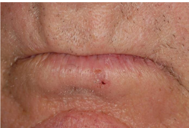
El basalioma: antes del tratamiento