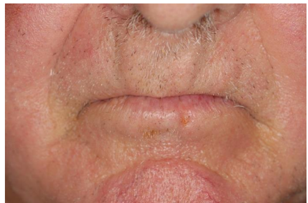
Después de 4 semanas de tratamiento