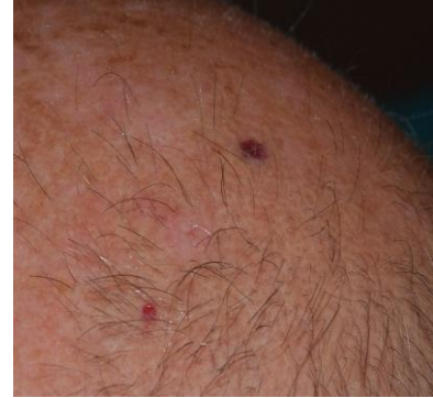
Después de 2 semanas de tratamiento

Existe un invento húngaro, hecho exclusivamente de sustancias naturales, la crema terapéutica R47- PROTUMOL ® , que no únicamente ofrece una protección contra las radiaciones nocivas, sino que ayuda también a destruir las células cancerosas. Este efecto ha sido comprobado por ensayos y experimentos realizados en la clínica de dermatología de una universidad de medicina de Hungría. La crema se absorbe rápidamente, no deja manchas en la ropa y puede aplicarse antes y después de tomar el sol. Los dermatólogos la recomiendan para la prevención y también para tratamiento terapéutico posterior.