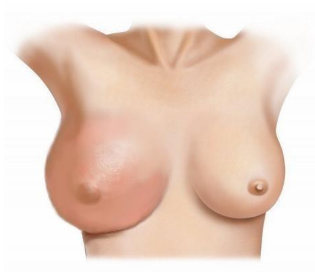
Cáncer de mama infectado

SOLUCIÓN PARA PREVENIR Y TRATAR EL CÁNCER DE MAMA: CREMA R47- PROTUMOL ® , CLÍNICAMENTE PROBADA