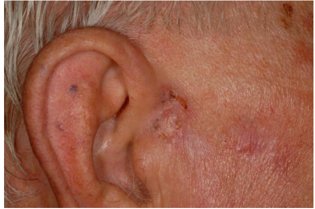
Después de 4 semanas de tratamiento