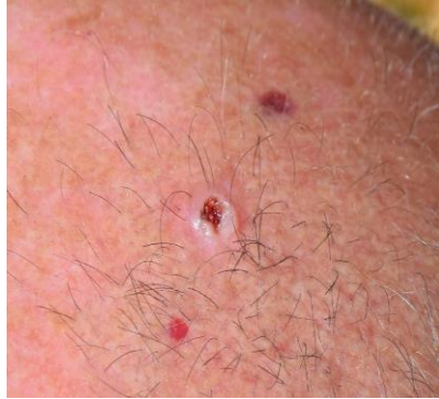
Después de 1 semana de tratamiento