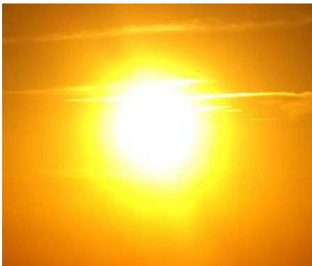
Radiación UVB →