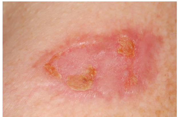
Después de 1 semana de tratamiento