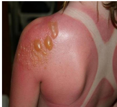
Quemadura solar →