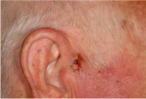
El basalioma: antes del tratamiento

Los componentes de las sustancias activas desarrollan su efecto en sinergia, ejerciendo un efecto fisiológico positivo durante el tratamiento. Gracias a la sinergia de las sustancias activas, la crema R47-PROTUMOL® produce un efecto en la zona tratada, pero paralelamente, gracias a la trascendencia de los componentes, favorece también todo el proceso curativo, robusteciendo el sistema inmunológico.