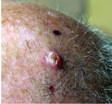
Antes del tratamiento