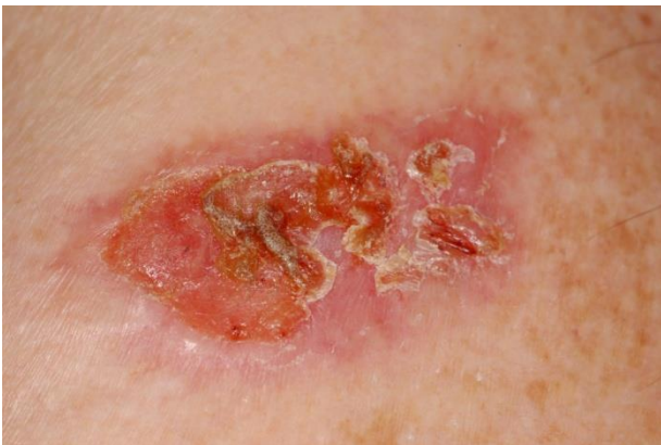
El basalioma: antes del tratamiento