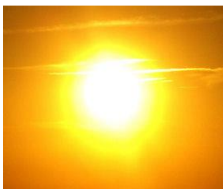
UVB излучение →