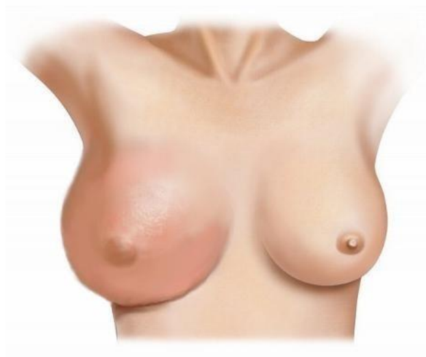
Воспалительный рак груди

РЕШЕНИЕ ДЛЯ ПРЕДУПРЕЖДЕНИЯ И ЛЕЧЕНИЯ РАКА ГРУДИ – ПРОШЕДШИЙ КЛИТИЧЕСКИЕ ИСПЫТАНИЯ КРЕМ R47-PROTUMOL®