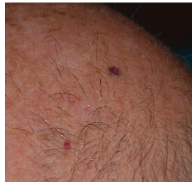
После 2 недель лечения

Венгерские исследователи изобрели препарат, который состоит исключительно из натуральных компонентов; это крем R47-PROTUMOL ® , и который не только обеспечивает защиту от вредного излучения, но способствует также уничтожению раковых клеток. Этот эффект подтверждён опытами и тестами, выполненными в дерматологической клинике одного из медицинских университетов Венгрии. Крем быстро впитывается, не оставляет пятен на одежде, его можно использовать до и после пребывания на солнце. Специалисты предлагают использовать препарат не только в превентивных целях, но и для последующего использования.