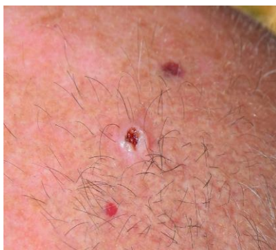
После 1 недели лечения